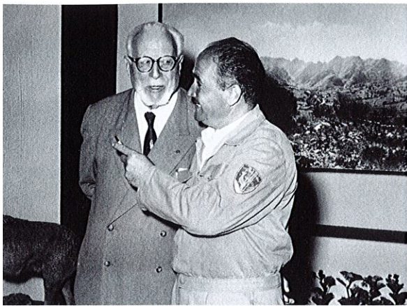
Ghigi a Pescasseroli, anni '60.

movimento e nella parte più dinamica e avanzata esso, a fianco di personaggi come Lino Vacca e Renato Pampanini. Ciononostante, e in modo abbastanza curioso, quando Luigi Vittorio Bertarelli nel 1922 ricostituisce il "Comitato nazionale per la difesa del paesaggio e dei monumenti italiani", conferma gli zoologi ma non riconferma, nonostante il loro prestigio, i botanici Pirotta e Pampanini.