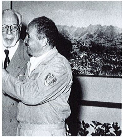
ni '60.